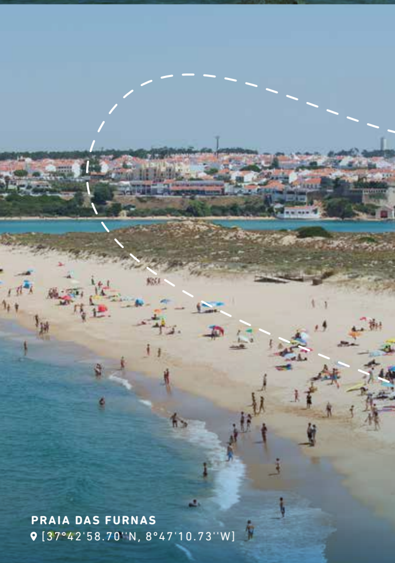
PRAIA DAS FURNAS 📍 [37°42'58.70"N, 8°47'10.73"W]