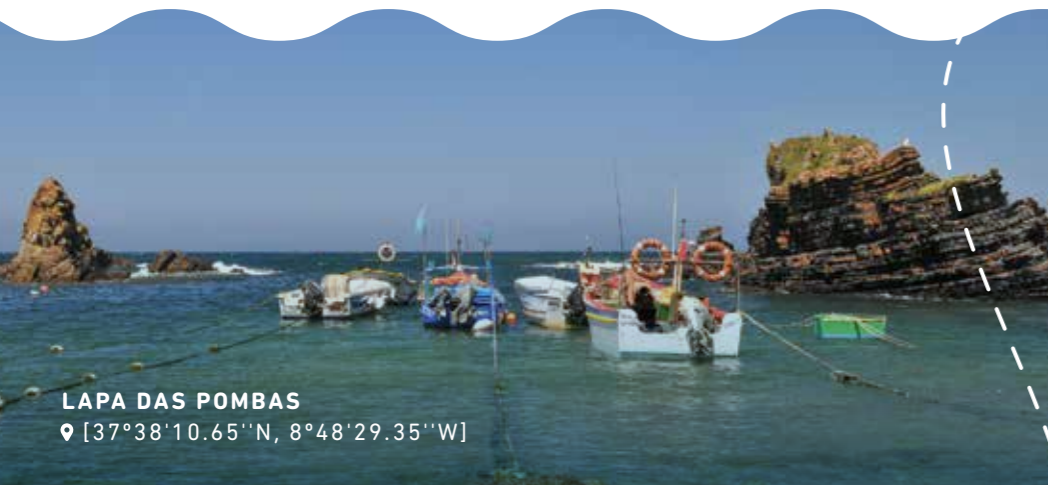
LAPA DAS POMBAS 📍 [37°38'10.65"N, 8°48'29.35"W]

The civil parish's patron saint is Nossa Senhora dos Navegantes (Our Lady of Seafarers) and tribute is paid to her on the third Sunday in August.