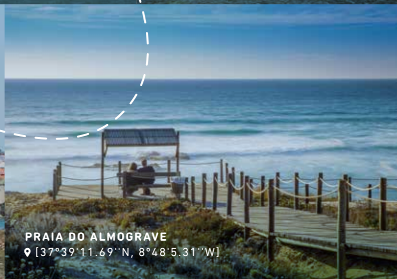
PRAIA DO ALMOGRAVE 📍 [37°39'11.69"N, 8°48'5.31"W]