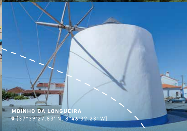
MOINHO DA LONGUEIRA 📍 [37°39'27.83"N, 8°46'32.23"W]