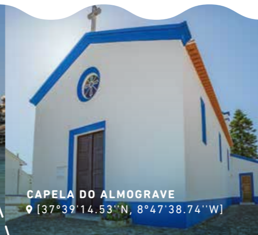
CAPELA DO ALMOGRAVE 📍 [37°39'14.53"N, 8°47'38.74"W]