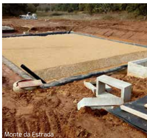
Monte da Estrada