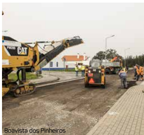
Boavista dos Pinheiros