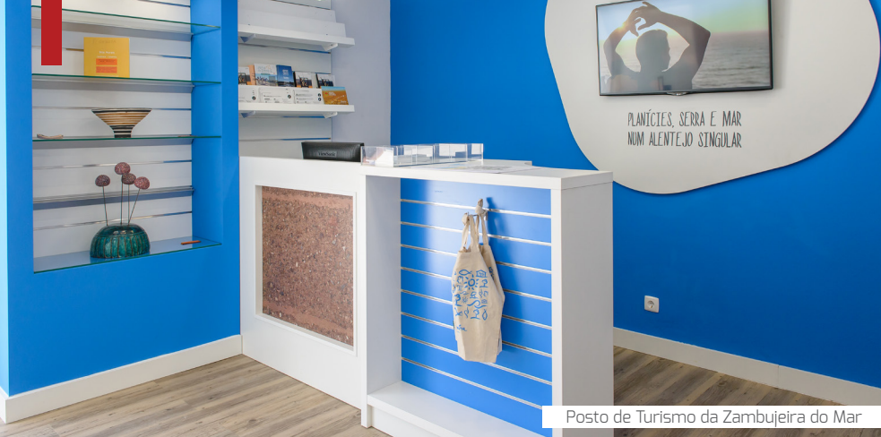
Posto de Turismo da Zambujeira do Mar