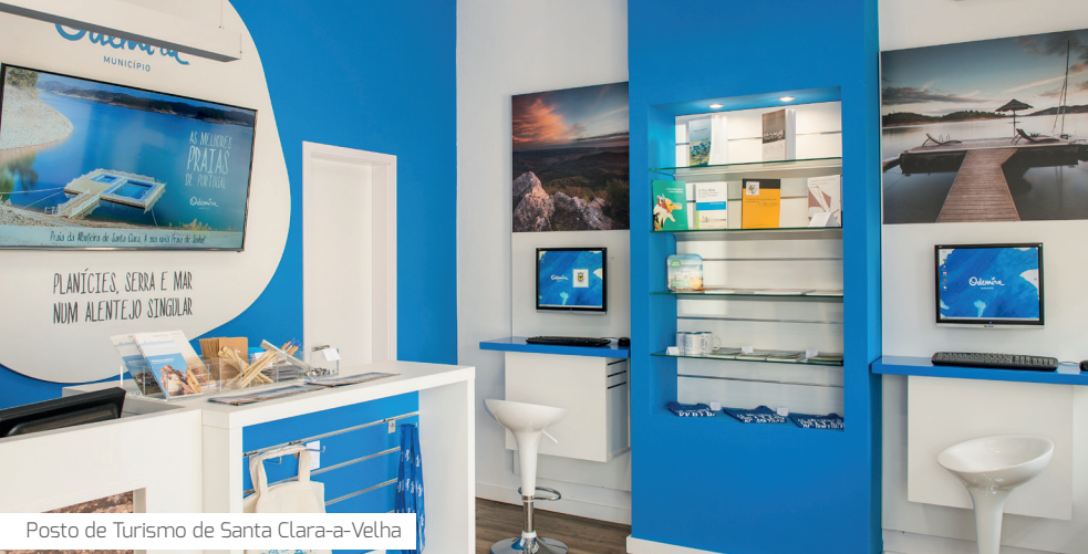
Posto de Turismo de Santa Clara-a-Velha