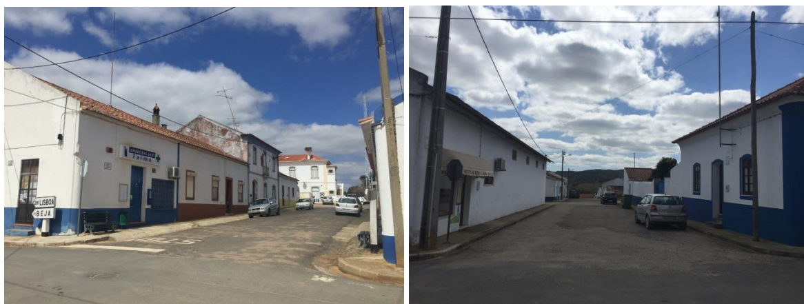
Figura 5 - Imagens de arruamentos.

A morfologia urbana do aglomerado estrutura-se por duas ruas principais, onde se localizam os equipamentos de utilização coletiva existentes e que dão acesso aos demais arruamentos do aglomerado. Os materiais dos pavimentos e o mobiliário urbano não contribuem para a valorização da imagem do aglomerado, onde frequentemente o pavimento em betuminoso de fachada a fachada imprime um carácter de espaço ‘rodoviário’ quando, a função e imagem desejada para estes espaços públicos deveriam privilegiar a circulação pedonal em detrimento do automóvel.