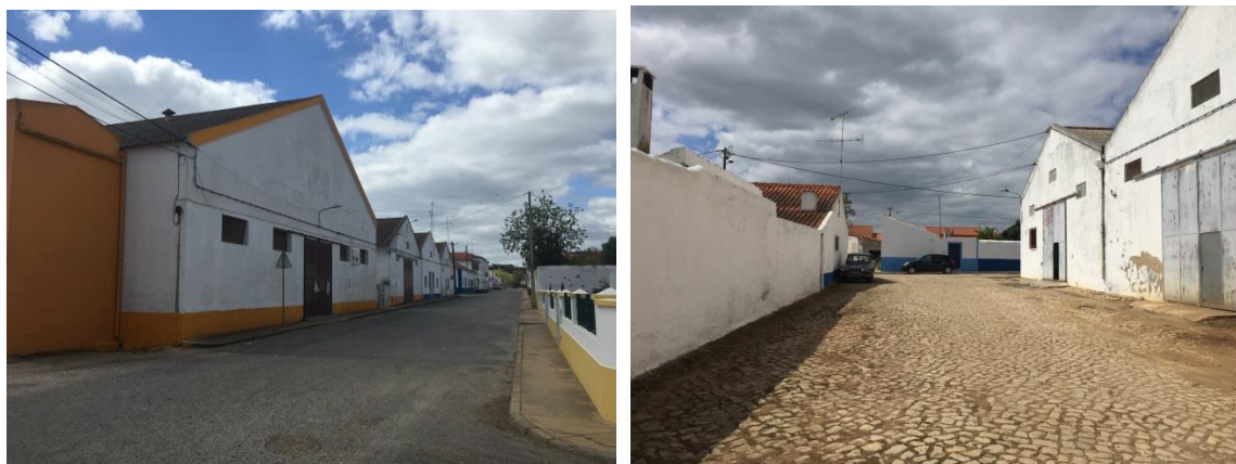
Figura 3 - Imagens de edifícios de carácter industrial / logístico.

O aglomerado preserva ainda algumas atividades económicas para além das atividades ligadas ao setor primário. Exigem algumas lojas, armazéns, pequenos serviços e estabelecimentos de restauração. Destaca-se o património imobiliário de carácter industrial / logístico que, apesar de maioritariamente abandonado, tem um enorme potencial para o desenvolvimento de atividades económicas e socioculturais, e beneficia de uma localização privilegiada face à estrutura urbana em que se insere e à proximidade da rede rodoviária e ferroviária.