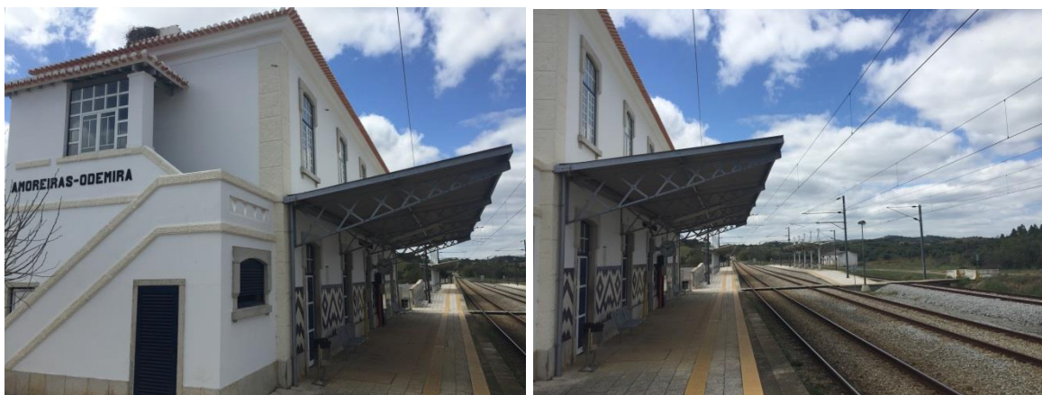
Figura 2 - Imagens do edifício da estação de ferroviária.

O aglomerado urbano de Amoreiras-Gare, pertencente à freguesia de São Martinho das Amoreiras, tem uma génese de desenvolvimento associada ao caminho-de-ferro, preservando ainda o edifício da estação Amoreiras-Odemira.