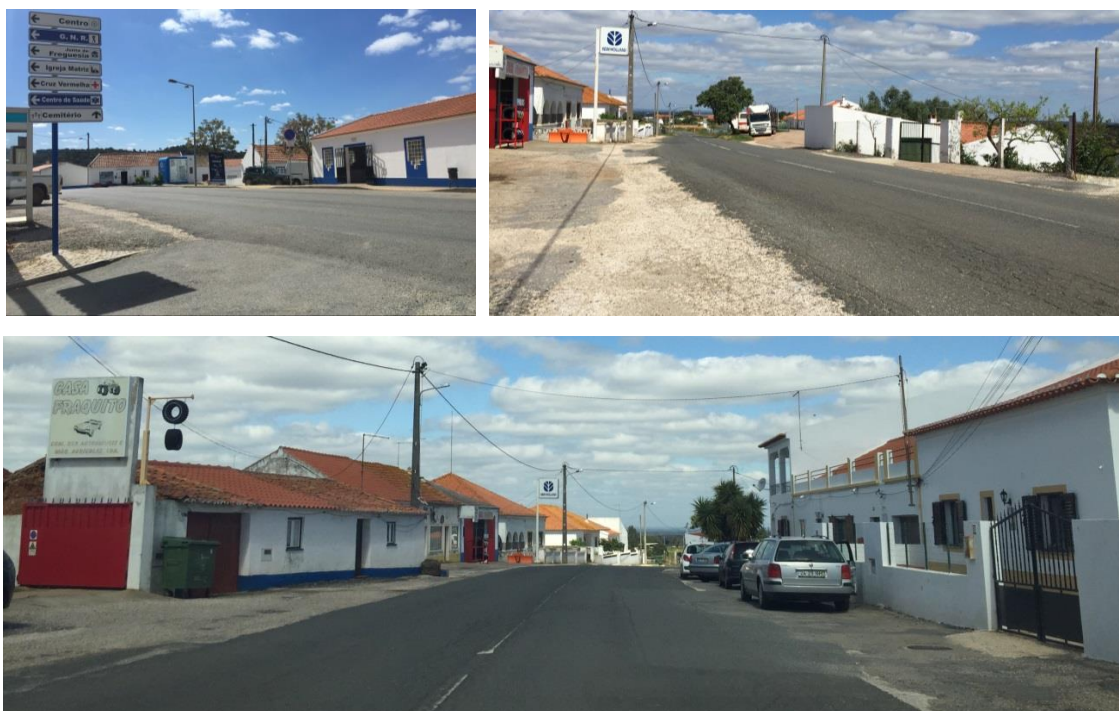
Figura 6 - Imagens da Estrada Nacional 389.

O aglomerado urbano de Colos é atravessado por uma estrada nacional (EN 389), ao longo da qual se consolidou o tecido urbano mais recente e onde se instalaram algumas das principais atividades económicas.