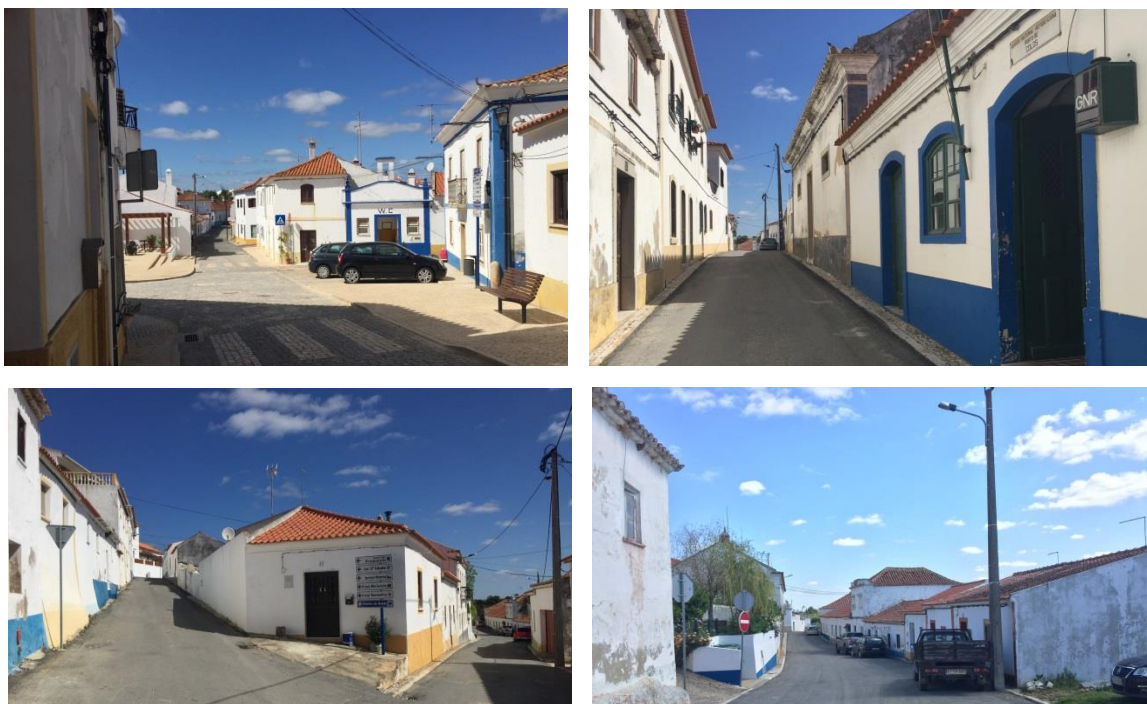
Figura 3 - Imagens do núcleo antigo de Colos: Rua 28 de Maio - Largo D. Manuel - Rua Carlos Maia.