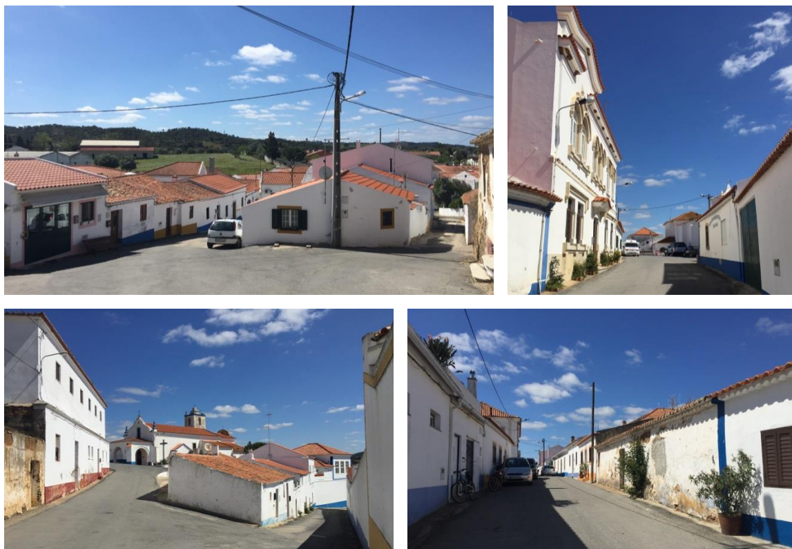
Figura 2 - Imagens do aglomerado: Rua do Saco - Rua José Correia de Oliveira - Rua D. Maria Júlia Brito Pais Falcão.

medieval compacto, a edificação dispersa-se pelos terrenos agrícolas envolventes, tendo a urbanização mais recente ocorrido ao longo das estradas nacionais 389 e 123-1.