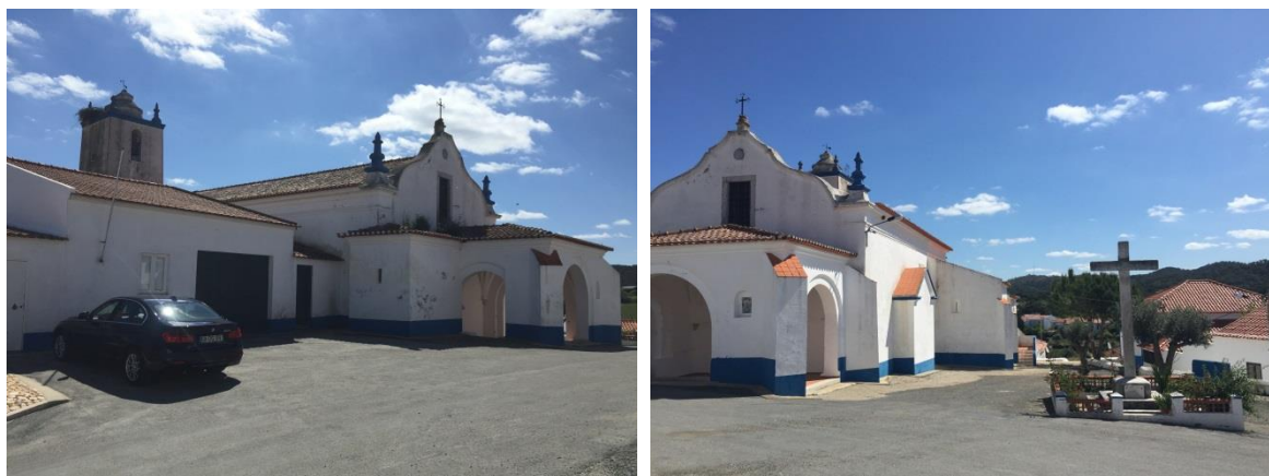
Figura 4 - Igreja de Nossa Senhora da Assunção (Igreja Matriz de Colos).

Assinala-se também, ao nível do patrimonial, um conjunto de edifícios que, pelas suas características arquitetónicas e história, conferem significado ao espaço e guardam memórias importantes para a identidade local como sejam a Igreja de Nossa Senhora da Assunção, ou Igreja Matriz, o edifício religioso mais importante de Colos, reconstruído em princípios do séc. XVI em substituição do templo medieval anteriormente existente no local, e a Capela de N. Sr. a do Carmo no centro da vila.