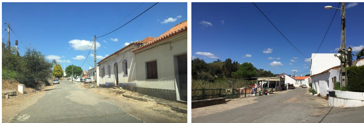
Figura 4 - Imagens de arruamentos.

A morfologia urbana do aglomerado estrutura-se por duas ruas principais, onde se localizam os equipamentos de utilização coletiva existentes e que dão acesso à maioria das edificações existentes no aglomerado. Os materiais dos pavimentos e o mobiliário urbano não contribuem para a valorização da imagem do aglomerado, onde frequentemente o pavimento em betuminoso de fachada a fachada imprime um carácter de espaço 'rodoviário' quando, a função e imagem desejada para estes espaços públicos deveriam privilegiar a circulação pedonal em detrimento do automóvel.