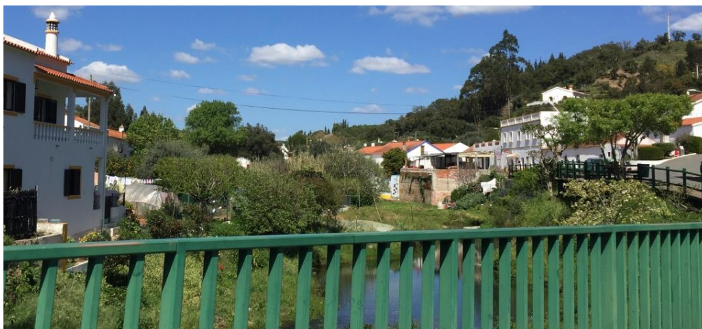
Figura 5 - Imagens do vale e linha de água.

Assinala-se o elevado potencial do Espaço Verde Urbano, associado ao pronunciado vale que enquadra a linha de água que percorre longitudinalmente todo o povoamento e que carece de melhores condições para ser usufruído em segurança pela população.