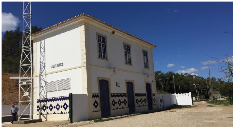
Figura 2 - Imagem do edifício da estação de ferroviária.

génese de desenvolvimento associada ao caminho-de-ferro, preservando ainda o edifício da estação de Luzianes e desenvolve-se longitudinalmente entre a linha de caminho-de-ferro e na envolvente da linha de água que define um vale sensivelmente paralelo à linha férrea.