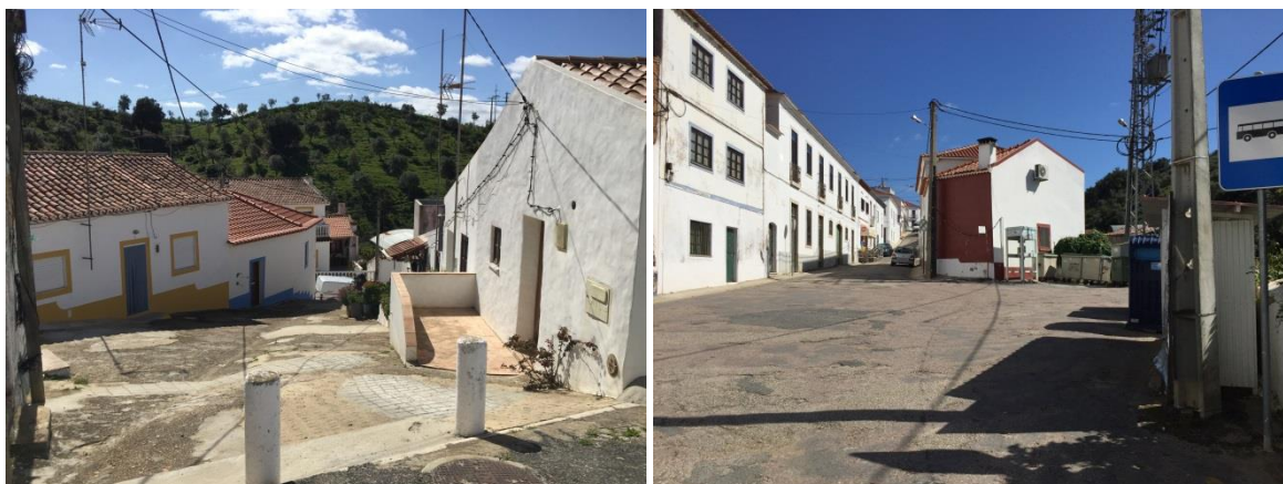
Figura 5 - Imagens de arruamentos.

Na zona Norte do povoamento de Relíquias é possível circundar todo o aglomerado pelo arrumamento principal que está na base da encosta e, contornando a zona dos equipamentos desportivos, subir até ao moinho percorrendo então o topo da encosta que se prolonga até ao cemitério e acede novamente à EM 532. No “miolo” do aglomerado existem um conjunto de arruamentos com um carácter de acesso local que ora são pouco inclinados, quando acompanham as curvas de nível, ora têm inclinações relativamente íngremes, quando se desenvolvem perpendicular às curvas de nível. Por outro lado, a zona dos Barreiros tem uma ocupação mais linear.