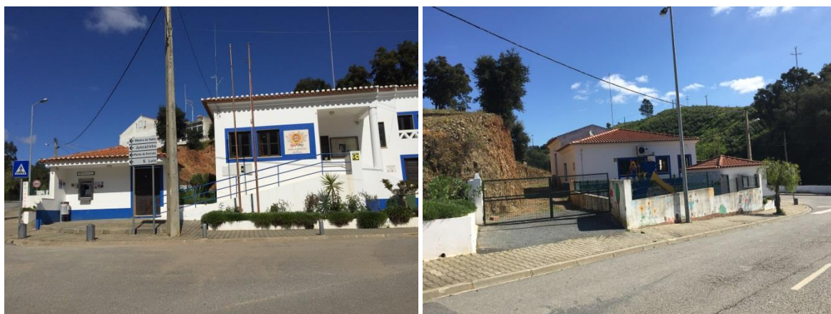
Figura 3 - Imagens do edifício da Junta de Freguesia à entrada do aglomerado.

A sede da Junta de Freguesia marca a entrada deste aglomerado, que para além das atividades ligadas ao setor primário, preserva alguns pequenos comércio, essencialmente mercearias ou minimercados e estabelecimentos de restauração.