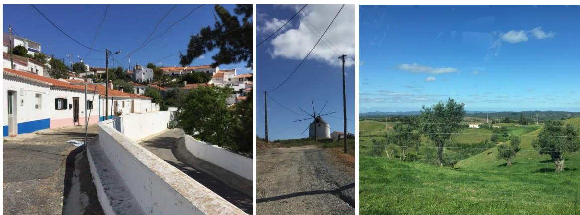
Figura 2 - Imagens do povoamento de Relíquias e sua envolvente.

A sede da Junta de Freguesia marca a entrada deste aglomerado, que para além das atividades ligadas ao setor primário, preserva alguns pequenos comércio, essencialmente mercearias ou minimercados e estabelecimentos de restauração.