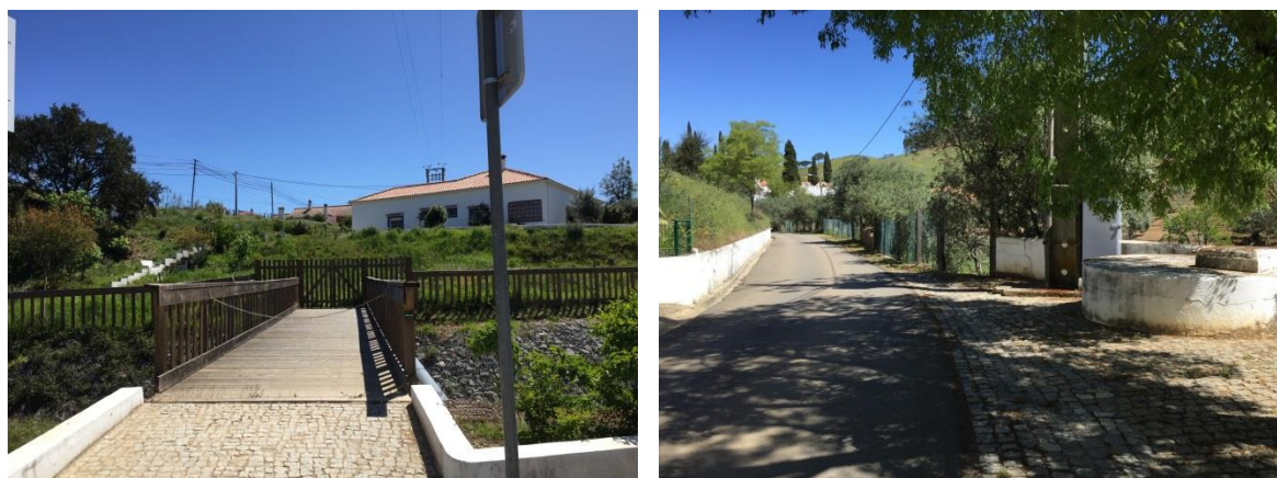
Figura 8 - Imagens de acessos ao Barranco do Ameixal.

Assinala-se ainda a ausência de espaços verdes de utilização coletiva e uma carência de arborização e ensombramento que, neste aglomerado do interior, poderia beneficiar bastante a vivência do espaço público dos largos, contribuindo para um aumento do conforto bioclimático particularmente no período estival.