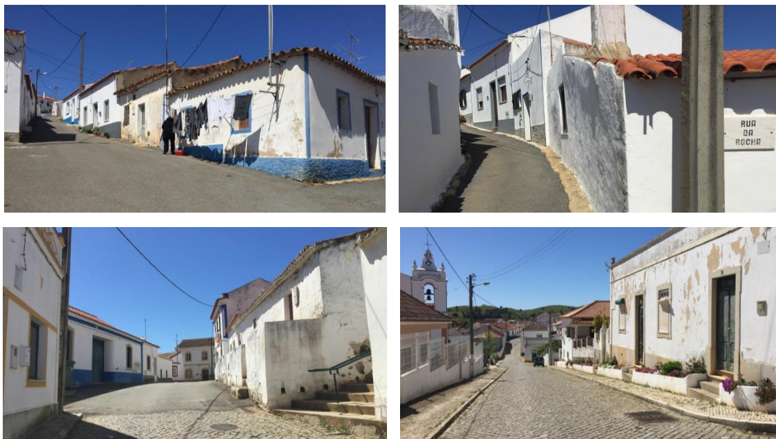
Figura 7 - Imagens de arruamentos.

A morfologia urbana do aglomerado estrutura-se a partir de um arruamento principal que se prolonga por toda a ARU, paralelamente ao à linha de água do Barranco do Ameixal, e que liga a um conjunto de arruamentos secundários que se ramificam pela encosta. O referido arruamento principal, que corresponde à Rua Gago Coutinho, tem acesso diretamente pela rotunda da EM552. Os materiais dos pavimentos e o mobiliário urbano não contribuem para a valorização da imagem do aglomerado, onde frequentemente o pavimento em betuminoso de fachada a fachada imprime um carácter de espaço ‘rodoviário’ quando, a função e imagem desejada para estes espaços públicos deveriam privilegiar a circulação pedonal em detrimento do automóvel.