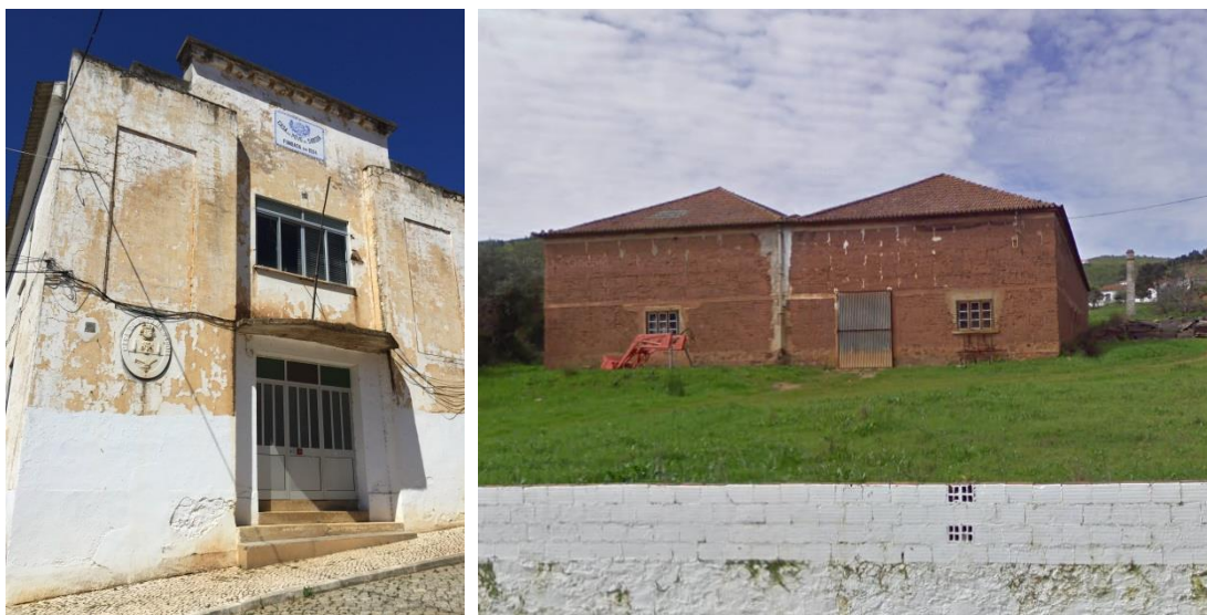
Figura 4 - Imagens de património edificado de relevo no contexto do aglomerado urbano Sabóia.

Na atualidade a sede de freguesia revela os sintomas da interioridade, como o despovoamento e o envelhecimento da população residente, mantendo contudo uma função de polo agregador de funções e serviços urbanos num território pouco povoado, marcado pela paisagem serrana algarvia, do interior sul do concelho.