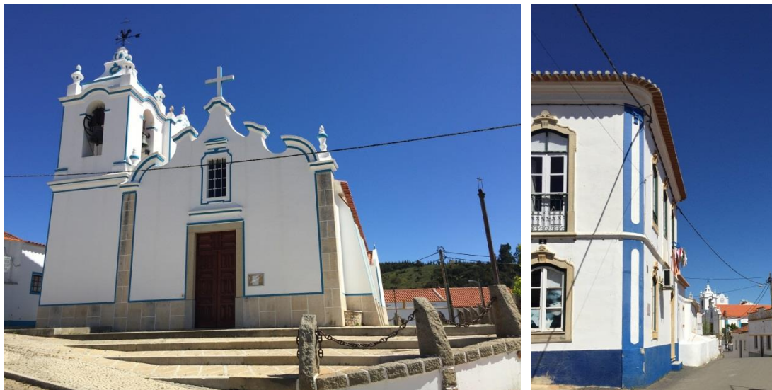
Figura 3 - Imagens de património edificado de relevo no contexto do aglomerado urbano Sabóia.

edifícios que, pelas suas características arquitetónicas e história, conferem significado ao espaço e guardam memórias importantes para a identidade local como sejam a Igreja Paroquial de Nossa Senhora da Assunção e a Capela da Boeira, assim como o edifício da antiga moagem, situado na entrada do aglomerado e que se pretende reabilitar.