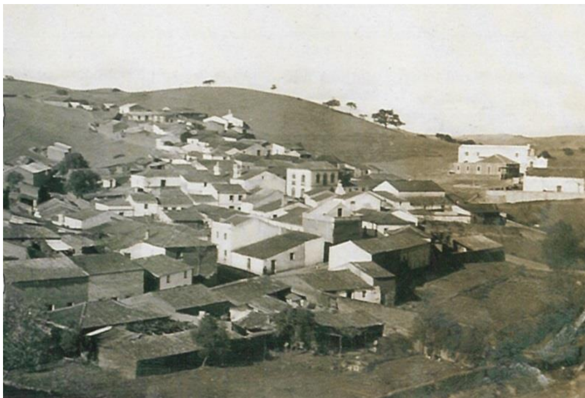
Figura 2 - Imagem panorâmica de Sabóia na década de 1930.

O aglomerado urbano situa-se a uma distância de cerca de 1 km do rio Mira e a ocupação do povoamento, abrangido pela ARU, desenvolve-se ao longo de uma das encostas da linha de água, designada Barranco do Ameixal, predominantemente orientada a Este. Apesar da proximidade ao rio Mira e ao barranco do Ameixal, a relação do aglomerado urbano com estas linhas de água não é favoravelmente explorada e aproveitada no contexto da sua integração com as funções urbanas.