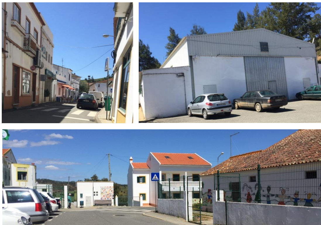
Figura 5 - Imagens do aglomerado urbano de Sabóia.

Entre as atividades económicas da freguesia destacam-se a agricultura, pecuária, produção florestal, construção e serralharia civil e alguns estabelecimentos de pequeno comércio e restauração. A maioria dos estabelecimentos de comércio e serviços situam-se na Rua Gago Coutinho, que é o principal arruamento de entrada no aglomerado, sendo que os demais serviços públicos e os equipamentos de utilização coletiva encontra-se distribuídos pelas zonas mais altas do aglomerado, com maior concentração no extremo Norte do perímetro urbano.