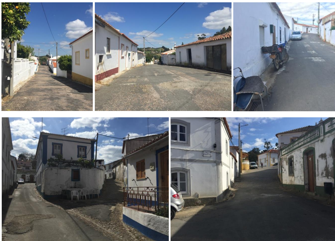
Figura 4 - Imagens de arruamentos.

A morfologia urbana deste núcleo populacional é densa e com uma estrutura orgânica, composta por ruas, becos, vielas, escadarias e largos que se ajustam à orografia do território onde se insere. Existem diversas situações em que os materiais dos pavimentos e o mobiliário urbano não contribuem para a valorização da imagem do aglomerado, onde o pavimento em betuminoso de fachada a fachada imprime um carácter de espaço 'rodoviário' quando, a função e imagem desejada para estes espaços públicos deveriam privilegiar a circulação pedonal em detrimento do automóvel.