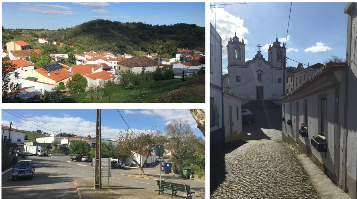
Figura 2 - Imagens do aglomerado urbano de São Martinho das Amoreiras.

A silvicultura é uma atividade económica que assume uma grande relevância na região, ainda assim, o aglomerado preserva ainda algumas atividades económicas para além das atividades ligadas ao setor primário. Exigem alguns pequenos serviços e comércio, essencialmente mercearias ou minimercados e estabelecimentos de restauração.