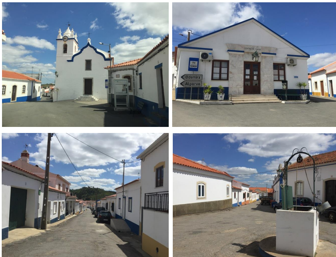
Figura 2 - Imagens do aglomerado urbano de Vale de Santiago.

Para além das atividades ligadas ao setor primário, o aglomerado preserva alguns pequenos comércios, essencialmente mercearias ou minimercados e estabelecimentos de restauração.