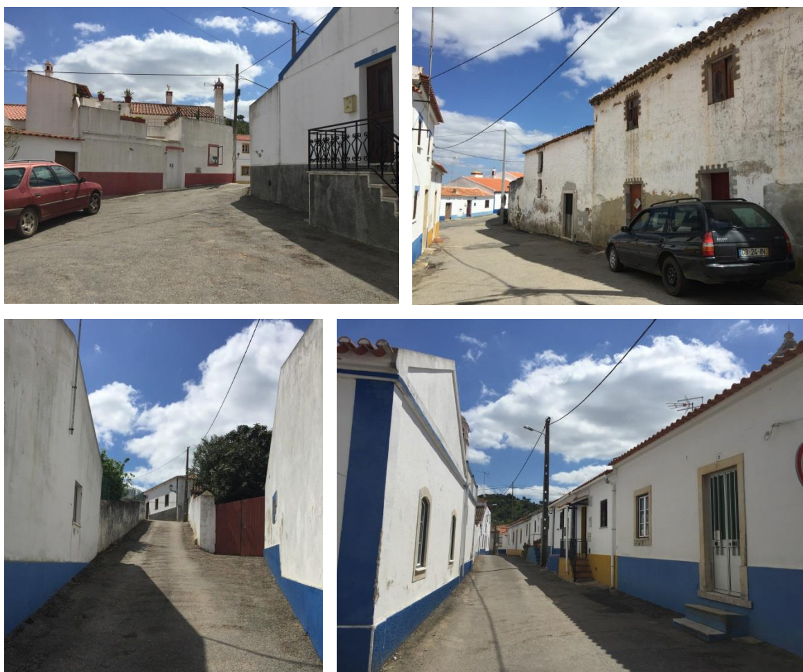
Figura 4 - Imagens de arruamentos.

Os materiais dos pavimentos e o mobiliário urbano não contribuem para a valorização da imagem do aglomerado, onde frequentemente o pavimento em betuminoso de fachada a fachada imprime um carácter de espaço ‘rodoviário’ quando, a função e imagem desejada para estes espaços públicos deveriam privilegiar a circulação pedonal em detrimento do automóvel.