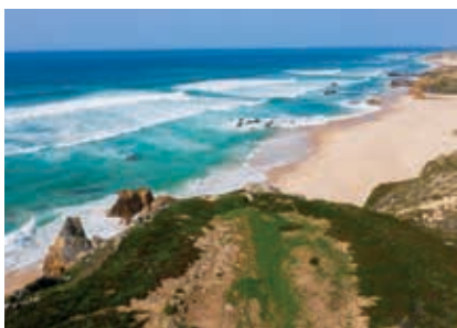
Praia do Malhão Norte

Seguindo a linha de costa em direção a sul, encontram-se duas praias, que vão buscar nome à aldeia vizinha, localizada a escasso 500 metros: a Praia do Almogrove Norte e a Praia do Almogrove Sul . No areal extenso formam-se piscinas naturais durante a maré baixa, que cativam famílias com crianças. Quando a maré enche e a rebentação cresce a Praia do Almogrove Sul é também procurada por praticantes de bodyboard e de surf . São ambas praias de Bandeira Azul e Qualidade de Ouro. Aproveite os bancos de madeira para usufruir da panorâmica sobre o mar ou assistir ao pôr-do-sol. A Praia da Zambujeira do Mar é um dos mais famosos e