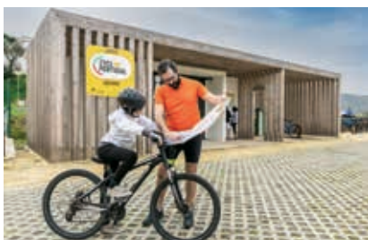
O Centro Cyclin'Portugal de Odemira situa-se no Parque Ribeirinho da vila

Sempre a pedalar, são mais de 1000 km em percursos de BTT / gravel, uma Grande Travessia, com 144,5 km, entre Amoreiras-Gare e Santa Clara-a-Velha, e um percurso de touring bike / cicloturismo para todos os que procuram natureza, adrenalina e um contacto com o mundo rural que é tão próprio do Sudoeste de Portugal. Esta rede de percursos atravessa o sistema de trilhos para BTT que passa tanto pela costa como