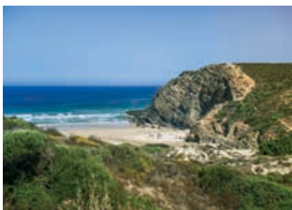
Praia do Carvalhal

Na margem sul do Mira, encontra-se a Praia das Furnas Mar , que tem como cenário de fundo os areais da Franquia e do Farol e parte de Vila Nova de Milfontes. É Praia Bandeira Azul, Qualidade de Ouro e Praia Acessível, com passadeiras e cadeira anfíbia para adultos e crianças. Já a Praia das Furnas Rio oferece excelentes condições para a prática de desportos náuticos. Com Bandeira Azul e Qualidade de Ouro é também uma Praia Acessível. Para aceder