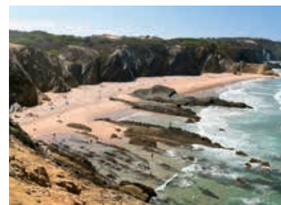
Praia dos Alteirinhos

os praticantes de diversos desportos aquáticos. Convida a longos passeios pelo areal, que fica a descoberto na maré baixa. Tem Bandeira Azul e foi distinguida com Qualidade de Ouro. Do alto do farol contemple a vista panorâmica. Acessível a partir da avenida Marginal, a Praia da Franquia é uma área balnear de rio, com Bandeira Azul e Qualidade de Ouro. Muito frequentada por famílias, tem na prática de canoagem e stand-up paddle uma constante.