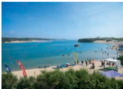
Praia da Franquia