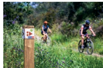
Os percursos de BTT / gravel estão devidamente identificados

O Centro Cyclin'Portugal de Odemira está localizado no Parque Ribeirinho da vila de Odemira, em zona de lazer, na margem esquerda do rio Mira, ao final da rua César Miranda. Homologado pela Federação Portu-