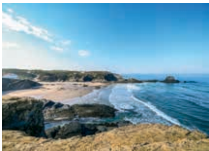
Praia da Zambujeira do Mar