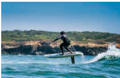
O foil é uma nova forma de descobrir a sensação de voar acima da água

A foz do rio Mira, em Vila Nova de Milfontes, é considerado o melhor local em Portugal para a prática do foil , a grande novidade nos desportos aquáticos, que desafia a descobrir a sensação de voar acima da água. Através da Foil Milfontes (tel. 963551232) é possível aprender as várias opções: wing foil (com um foil e uma asa insuflável), SUP foil (stand-up paddle) , surf foil ou tow foil (a modalidade ideal para