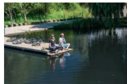
O Espelho de Água de Santa Clara é um dos locais de paragem

etapas, em que cada uma pode corresponder a um dia de viagem (ver quadro na página acima). O trajeto segue sobretudo por caminhos, estradões e estradas com pouco trânsito. Embora siga com frequência por troços de outros percursos da rede de BTT, evita as passagens mais técnicas, tendo por isso uma percentagem maior de asfalto. Com passagem por pequenas aldeias, o percurso, devidamente identificado, desenrola-se sobretudo em zonas