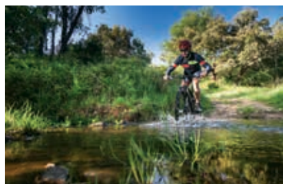
No concelho de Odemira existe uma rede de bike stations de apoio aos ciclistas

de entrada do Centro Cyclin'Portugal de Odemira, partindo da estação de comboios de Amoreiras-Gare ou da Funcheira, atravessa Colos, São Luís, Odemira e São Teotónio para terminar em Santa Clara-a-Velha, depois de passar pela estação de Saboia. Indicado para todas as épocas do ano, é um percurso bastante longo, mas de nível técnico relativamente baixo, acessível a bicicletas do tipo BTT, gravel e touring . A Grande Travessia é organizada em cinco