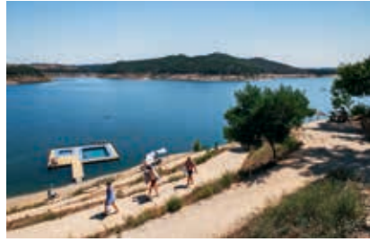
A zona balnear da albufeira da barragem de Santa Clara ostenta Bandeira Azul

baloíça junto à margem do rio. Tem ainda chapéus de colmo numa zona relvada.