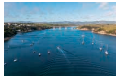
Vila Nova de Milfontes é um destino ímpar para os desportos náuticos

Considerado o “rio natureza”, dado o nível de preservação e sendo um dos menos poluídos da Europa, o Mira atravessa todo o concelho de Odemira e é palco para passeios descontraídos de caiaque ou canoa, que ajudam a descobrir a beleza envolvente. Todo o vale entre Odemira e a foz do rio está integrado na área do Parque Natural do Sudoeste Alentejano e Costa Vicentina. A partir da praia da Franquia é possível deslizar em stand-up paddle ou de canoa com a SW SUP (tel. 963551232) ou com a BeSurf (tel. 966700008). Os espaços para praticar estes desportos estão delimitados por boias, procurando não interferir com