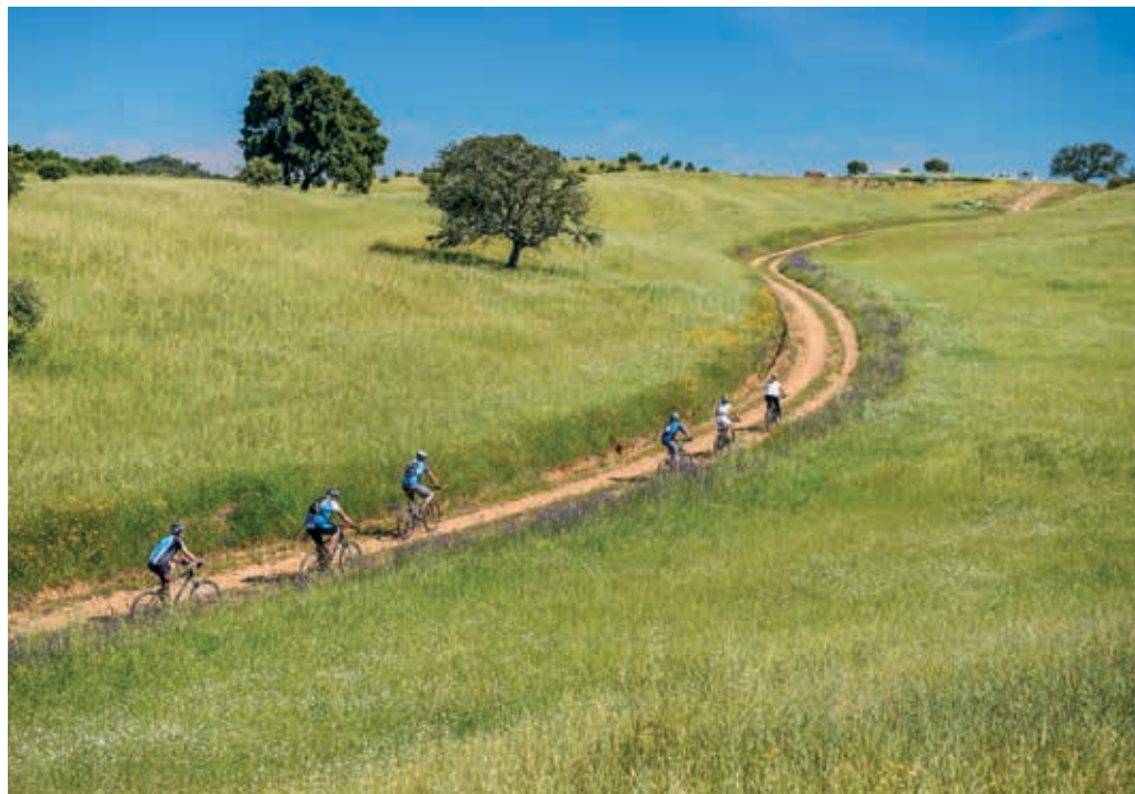
A rede de percursos permite conhecer o interior rural do concelho de Odemira

pelo interior. Oferece também a possibilidade de touring bike . No global, a rede de trilhos cicláveis da Rota Vicentina engloba 18 bike stations , cerca de 40 associados bike friendly e o Centro Cyclin'Portugal de Odemira, que é a principal estrutura de apoio aos ciclistas da Costa Alentejana e Vicentina. É, também, um convite permanente a visitar este território, tanto para portugueses como público internacional que, além do gosto por pedalar, partilham o interesse pelo contacto com a natureza e por uma cultura rural viva e autêntica. Aos trilhos e caminhos rurais e de serra que podem ser usufruídos de bicicleta, juntam-se paisagens deslumbrantes, aldeias que parecem perdidas e pessoas que vivem estes trilhos como parte da sua herança.