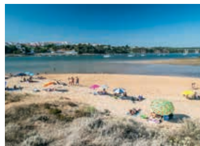
Praia das Furnas Rio

fotografados destinos do litoral alentejano. Situada junto à aldeia da Zambujeira do Mar, a praia é um dos bilhetes postais da região, com a rocha Palheirão como verdadeiro ícone local, a par da capela de Nossa Senhora do Mar. Oferece excelentes condições para a prática de surf e bodyboard . Está classificada como Praia Acessível.