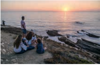
Na Zambujeira do Mar assiste-se ao mais bonito pôr-do-sol do mundo

do concelho de Odemira. Fique até ao final do dia. Dizem que o pôr-do-sol na praia da Zambujeira do Mar é o mais bonito do mundo. O muro junto à falésia, os miradouros para o mar e a praia são locais possíveis para ficar, contemplar com tempo e calma e esperar um dos momentos mágicos da costa atlântica, o ocaso sobre o mar.