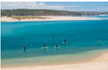
A Estação Náutica de Odemira agrega as várias experiências náuticas do concelho

O rio Mira vive-se de outra forma em plena vila de Odemira. Na frente ribeirinha renovada avistam-se as canoas e caiaques da Ecotrails (tel. 967155383), com possibilidade de guia para remar à descoberta do rio, mergulhar e fazer um piquenique. No regresso, sente-se no banco de madeira que