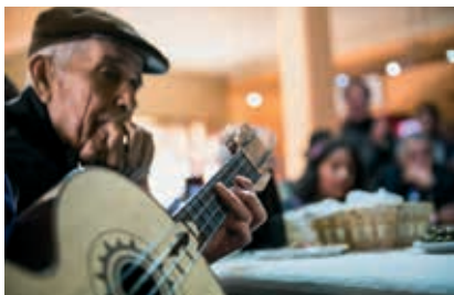
A viola campaniça é um importante elemento da identidade cultural do concelho

Ainda em Odemira, o Monumento ao Cante Alentejano, inaugurado em 2022, impõe-se na paisagem. Esta peça de grandes dimensões, da autoria do escultor Fernando Fonseca, presta homenagem ao Cante Alentejano – classificado como Património Imaterial da Humanidade – e respetivos intérpretes, perpetuando a memória e incentivando novas gerações a manterem viva esta afirmação da cultura local.