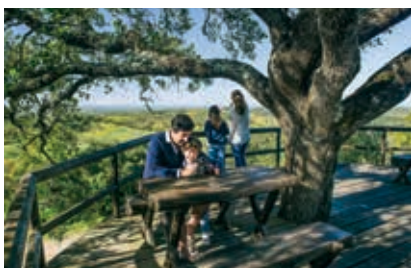
No alto da ermida da Senhora das Neves, o alcance da paisagem encanta os viajantes

Referência obrigatória para o cante ao baldão acompanhado pela viola campaniça, que constitui um dos mais fortes marcos na identidade cultural do concelho. Na verdade, tanto este instrumento tradicional como os cantares associados têm vindo a ser recuperados através de encontros, espetáculos e mostras em feiras de artesanato, mas, sobretudo, pelo gosto de quem a toca. O Centro de Valorização da Viola Campaniça e do Cante de Improviso, localizado em São Martinho das Amoreiras, promove o ensino da construção e do toque tradicional do instrumento, bem como a divulgação