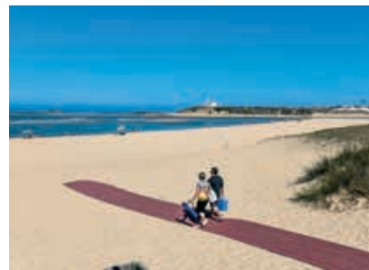
Praia das Furnas Mar