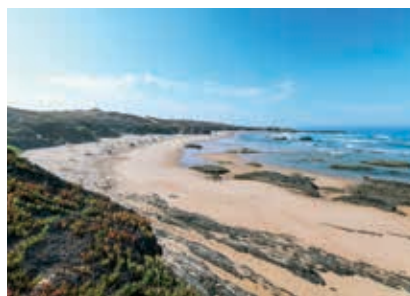
Praia do Almogrove Norte

prática de surf e bodyboard . Desde 2019, a Praia do Malhão Norte é oficialmente uma praia naturista. Ambas as praias ostentam Bandeira Azul e o galardão Qualidade de Ouro.