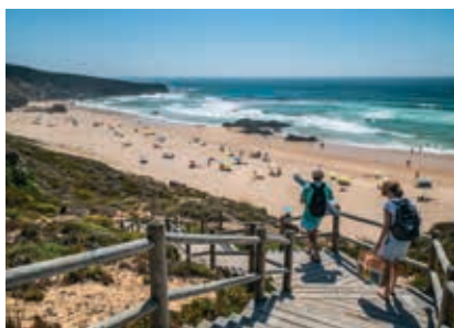
Praia do Malhão Sul