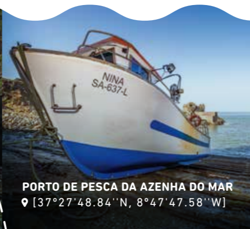
PORTO DE PESCA DA AZENHA DO MAR 📍 [37°27'48.84"N, 8°47'47.58"W]