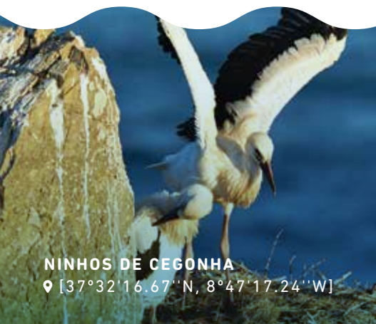
NINHOS DE CEGONHA 📍 [37°32'16.67"N, 8°47'17.24"W]

The religious feast of São Teotónio, dedicated to Nossa Senhora do Rosário (Our Lady of the Rosary), takes place in August and the religious celebrations in honour of Zambujeira do Mar's patron saint – Nossa Senhora do Mar (Our Lady of the Sea) – are held on the 15th of August.