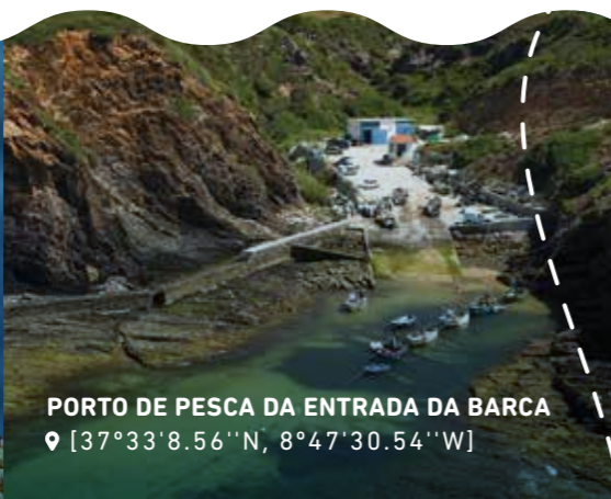
PORTO DE PESCA DA ENTRADA DA BARCA 📍 [37°33'8.56"N, 8°47'30.54"W]