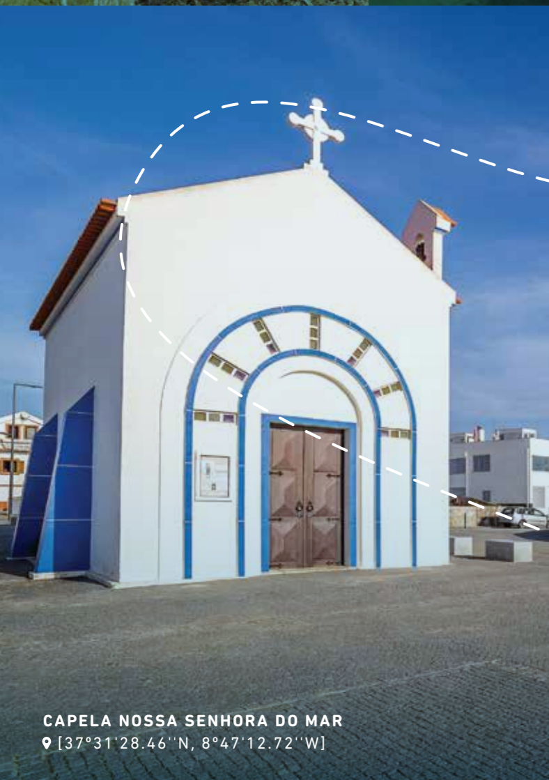
CAPELA NOSSA SENHORA DO MAR 📍 [37°31'28.46"N, 8°47'12.72"W]